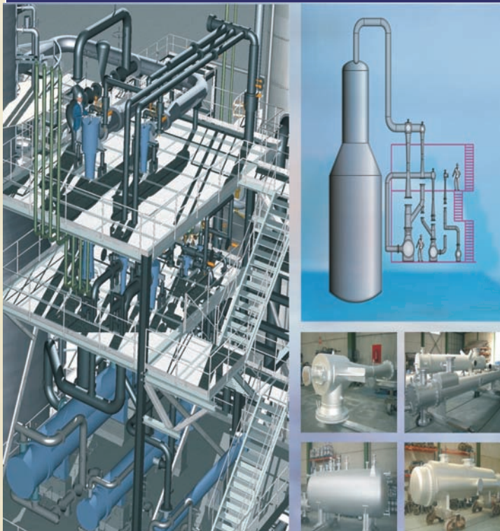
PRESION DE ASPIRACION: 7.5 TORR DISEÑADO PARA UNA UNIDAD DE REDUCCION DE FUELOLEO (URF)