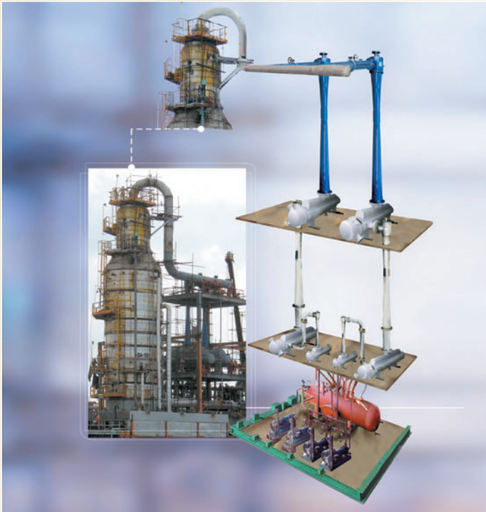
PRESION DE ASPIRACION: 19 TORR DISEÑADO PARA UNA COLUMNA PREPARATORA DE CARGA EN LINEA DE REFINACION