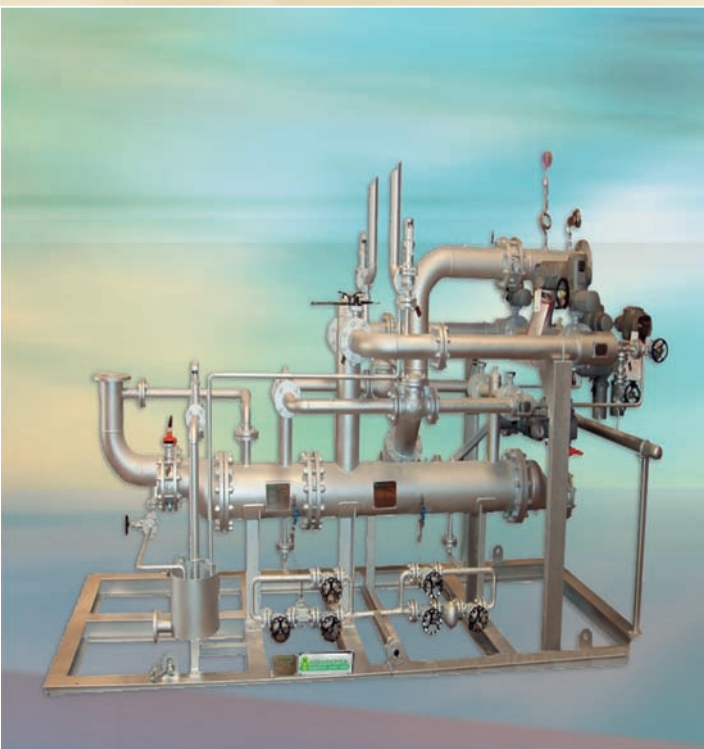
PRESION DE ASPIRACION: 45 TORR. EXTRACCION A VACÍO DE UNA MEZCLA DE AIRE Y VAPOR EN UN AERO-CONDENSADOR