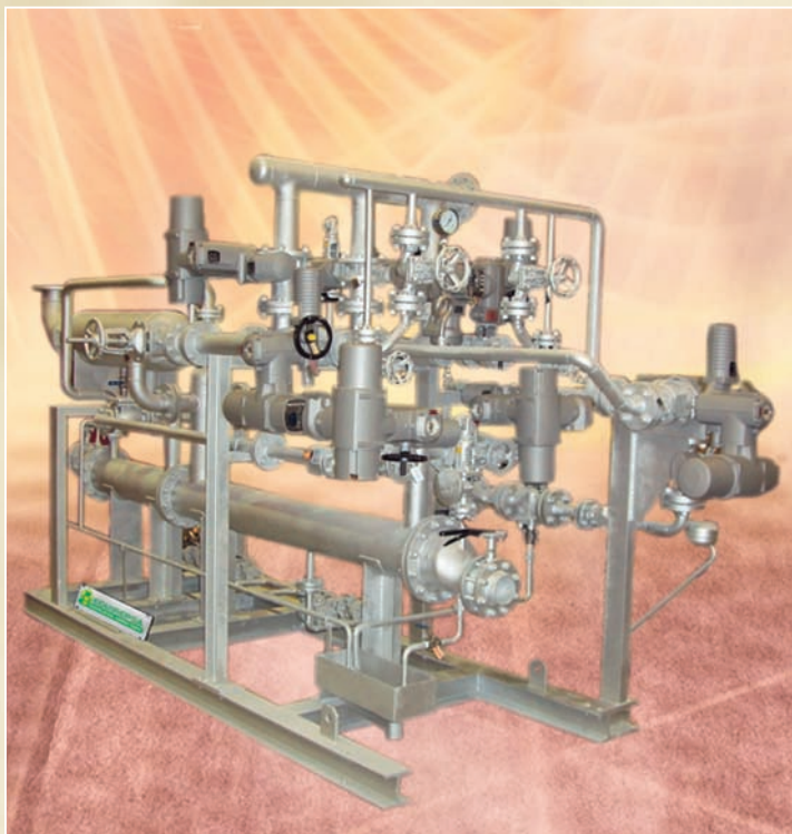
PRESION DE ASPIRACION: 161 TORR. EXTRACCION A VACÍO DE UNA MEZCLA DE AIRE Y VAPOR EN UN AERO-CONDENSADOR