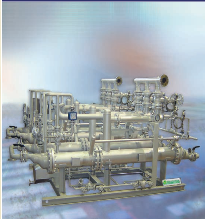
PRESION DE ASPIRACION: 37 TORR. EXTRACCION A VACÍO DE UNA MEZCLA DE AIRE Y VAPOR EN UN CONDENSADOR