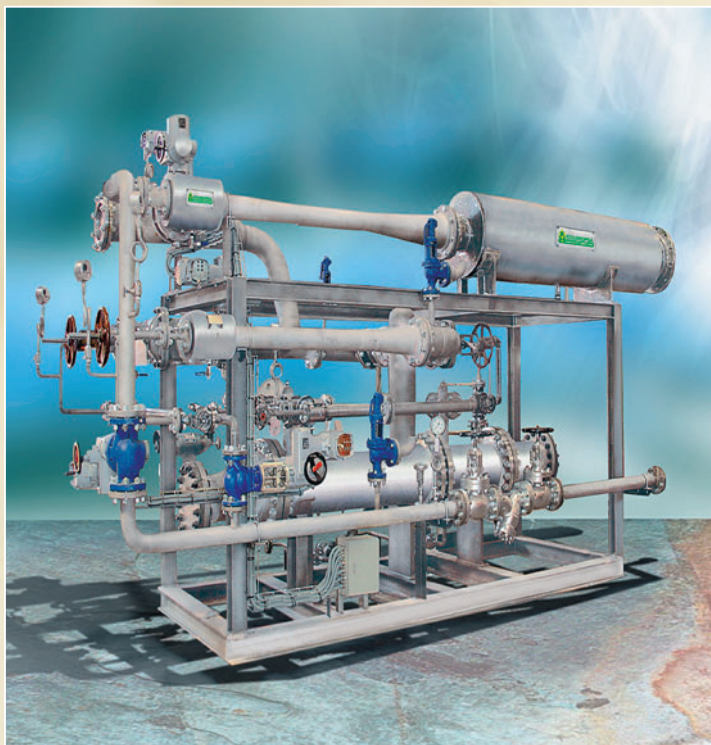
PRESION DE ASPIRACION: 25 TORR. EXTRACCION A VACIO DE UNA MEZCLA DE AIRE / VAPOR SATURADO EN UN CONDENSADOR