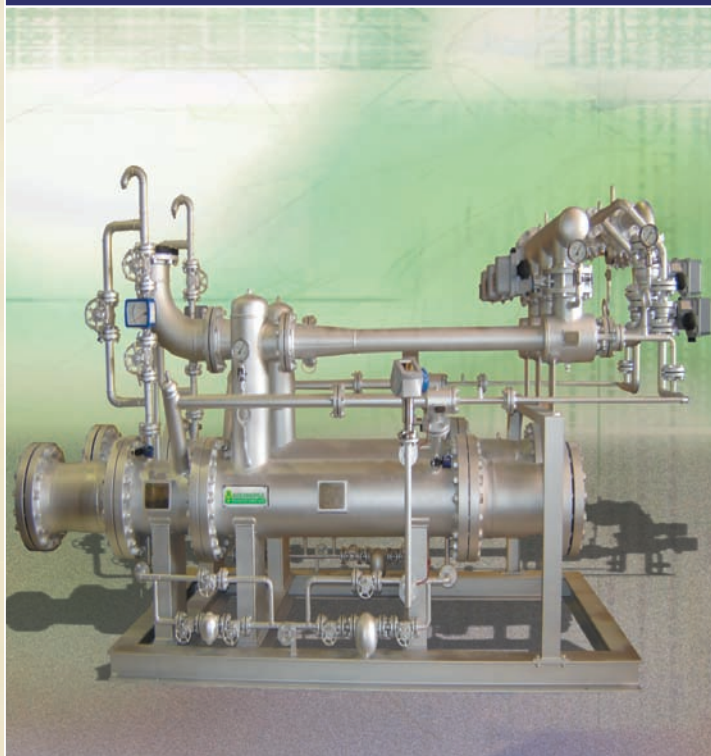
PRESION DE ASPIRACION: 41 TORR. EXTRACCION A VACIO DE UNA MEZCLA DE AIRE / VAPOR SATURADO EN UN CONDENSADOR