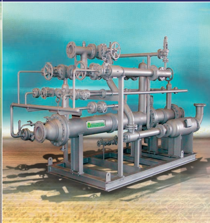
PRESION DE ASPIRACION: 31TORR. EXTRACCION A VACIO DE UNA MEZCLA DE AIRE / VAPOR SATURADO EN UN AERO-CONDENSADOR