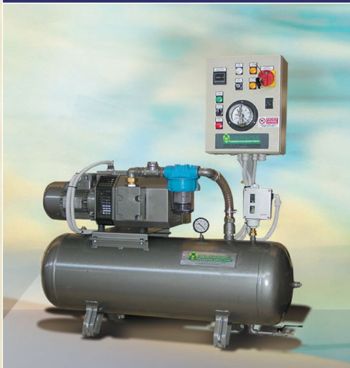
PRESION DE ASPIRACION: 7 TORR. DISEÑADO PARA LA ASPIRACION DE VIRUTAS METALICAS EN TALLER DE JOYERIA