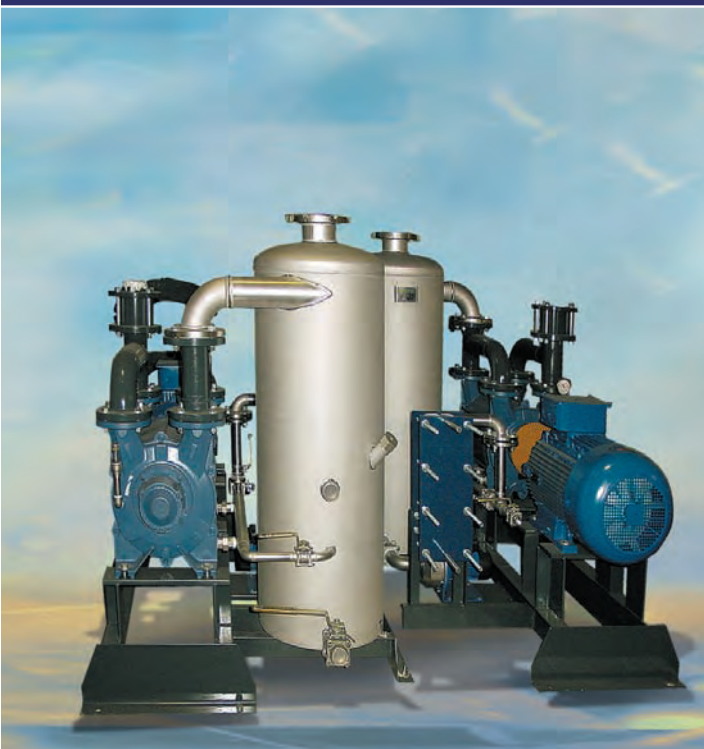
PRESION DE ASPIRACION: 170 TORR ABS. DISEÑADO PARA LA PRODUCCION DE VACIO EN UNA PLANTA DE UREA