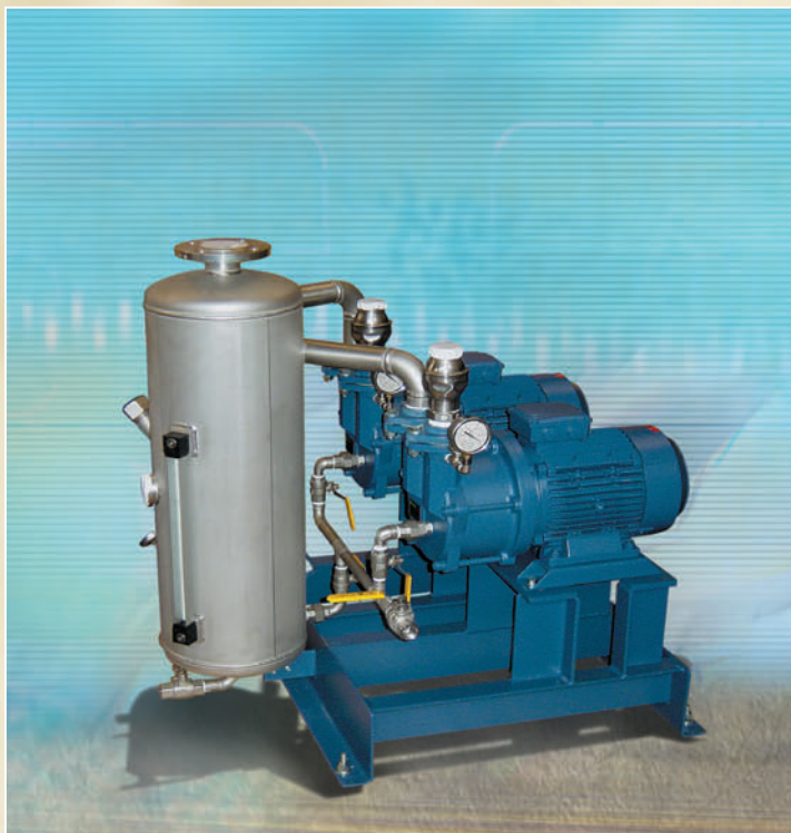
PRESION DE ASPIRACION: 75 TORR. DISEÑADO PARA EL CEBADO DE BOMBAS DE AGUA EN UNA PLANTA DESALADORA