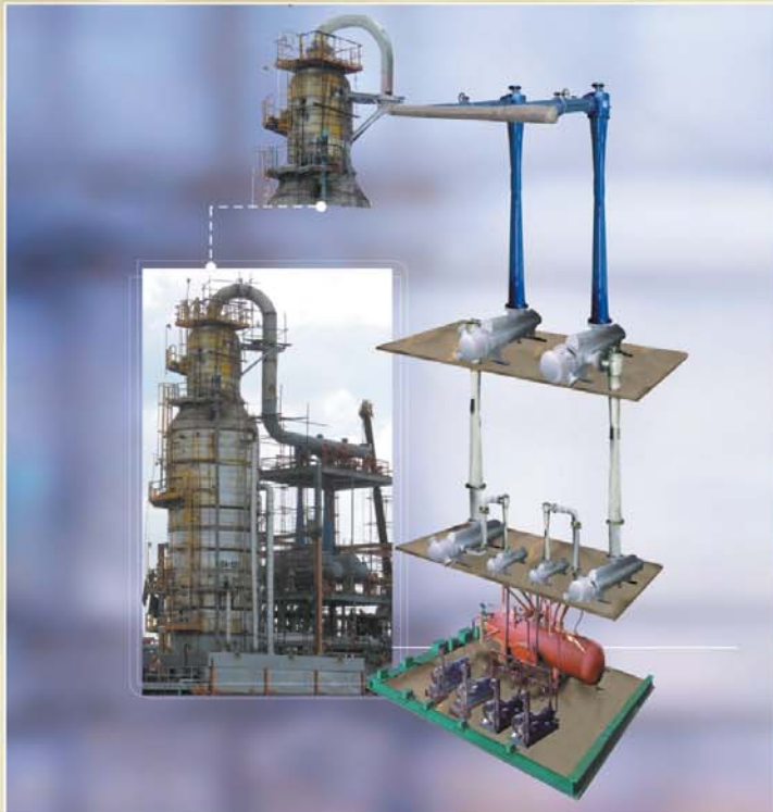
PRESION DE ASPIRACION: 19 TORR DISEÑO PARA UNA COLUMNA PREPARADORA DE CARGA EN LINEA DE REFINACION