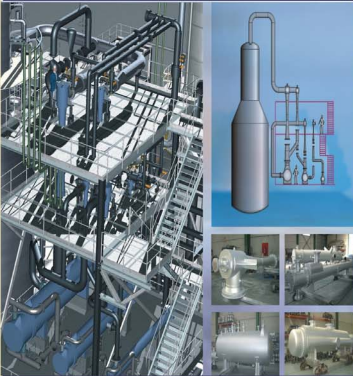
PRESION DE ASPIRACION: 7.5 TORR DISEÑO PARA UNA UNIDAD DE REDUCCION DE FUELOLEO (URF)