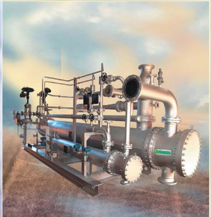
PRESION DE ASPIRACION: 75 TORR DISEÑO PARA LA ELIMINACION DEL AGUA DEL DIESEL